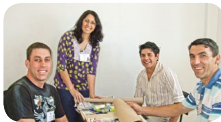
Funcionários montaram um boneco para demonstrar capacidade de união entre as pessoas

Em 2011, novas turmas participarão do projeto Gente em Ação desenvolvido na Copercampos, através do setor de treinamentos.