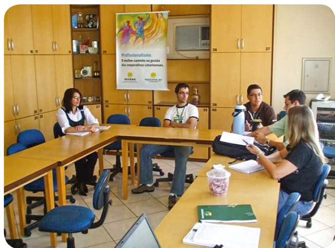
Audidores se reuniram para definir ações do programa

A coordenação ressalta que agora é o momento de preencher corretamente os diagnósticos e que os problemas existentes sejam solucionados o mais rápido possível.