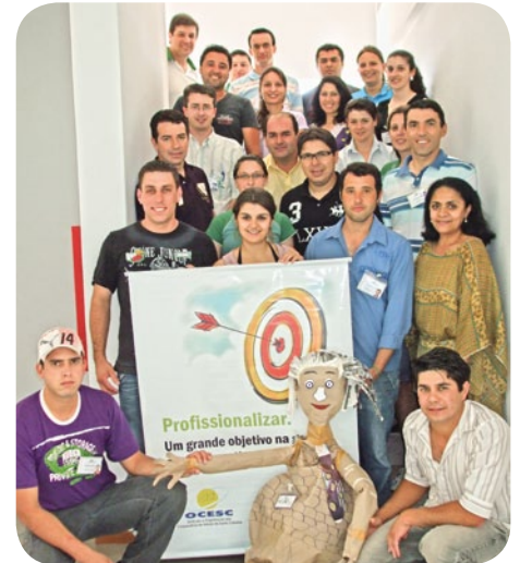
Participantes do programa