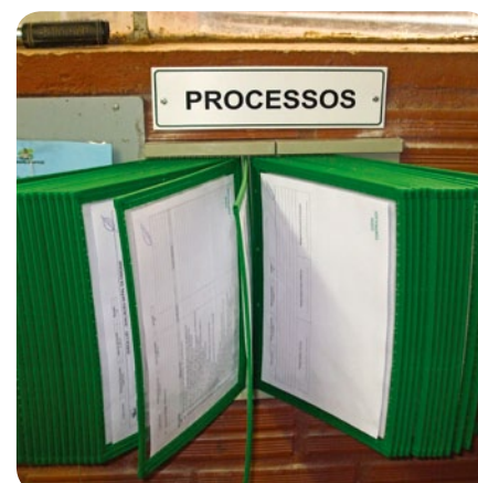
Processos definem formas de trabalhar nos diversos setores da cooperativa