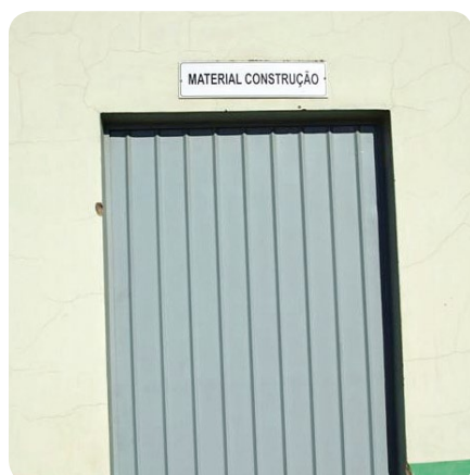
Etiquetas de identificação facilitam trabalho