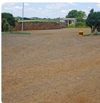
Organização é fundamental para a qualidade