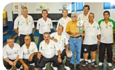
Equipe da Copercampos foi a campeã com 1.402 palitos

A Associação Atlética Copercampos (AACC), realizou no dia 21 de novembro, a segunda Taça Linei Antunes de Bolão.