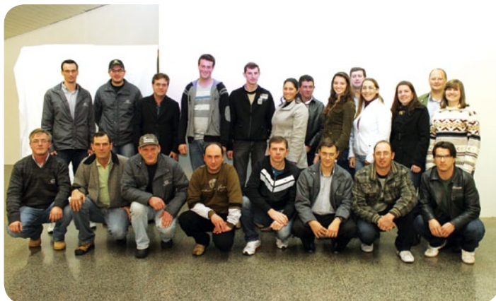
Membros da nova diretoria da AACC

Na noite do dia 21 de junho, a diretoria da Associação Atlética Copercampos (AACC) realizou na sede social da entidade, a Assembleia Geral Ordinária (AGO) que apresentou o balanço da gestão 2011/2012 e também apresentou os novos membros da diretoria da associação gestão 2012/2013.