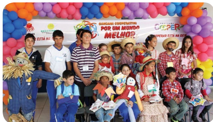
Mascotes das equipes que participam da Gincana Cooperativista