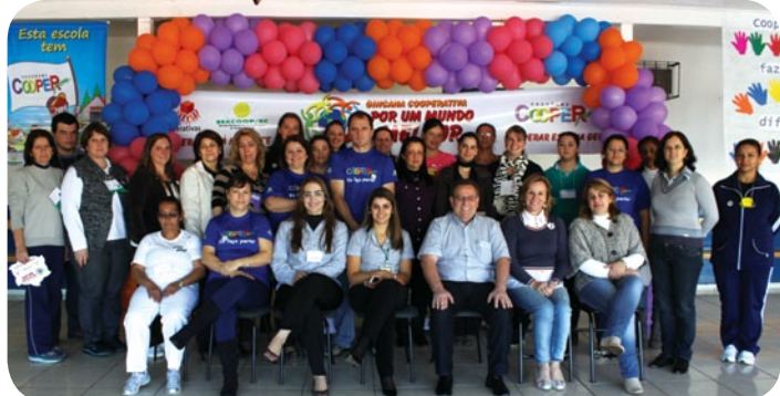
Professores da Escola Municipal Santa Julia Billiart e representantes da Copercampos

Ao todo, o projeto será desenvolvido com o apoio de 15 cooperativas e 45 escolas da rede de ensino público municipal e estadual, e estima-se que irá atender a mais de 20 mil pessoas em todo o Estado.