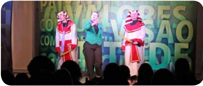
Teatro Seu Chico apresentou conceitos para a vida na empresa e na sociedade

A Copercampos realizou de 19 a 23 de setembro a XXVI – Semana Interna de Prevenção ao Acidente de Trabalho – Sipat 2011. Com o objetivo de dinamizar as ações de prevenção, segurança e saúde no trabalho, a Comissão Interna de Prevenção de Acidentes – CIPA trouxe mecanismos inovadores e diferenciados para a melhoria da qualidade de vida dos funcionários.