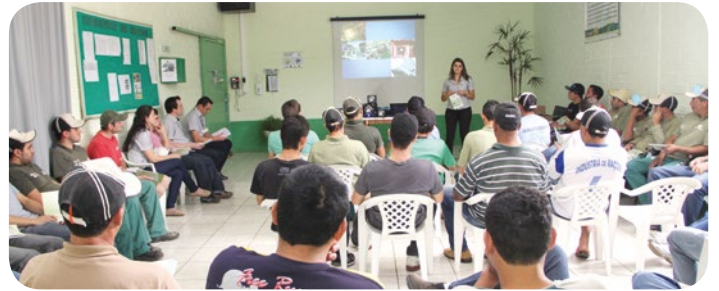
Funcionários da Indústria de Rações participam de treinamento sobre o manual de atendimento