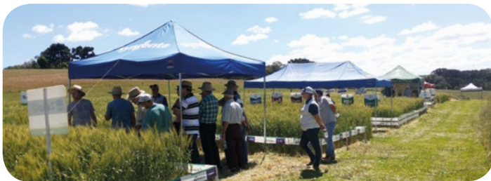
Dia de Campo em São José do Ouro