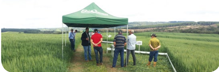
Dia de Campo em Bom Retiro