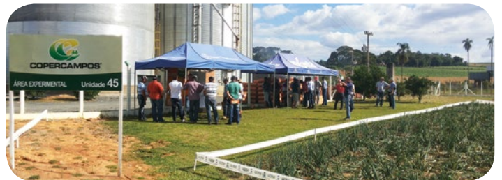
Dia de Campo em Ituporanga