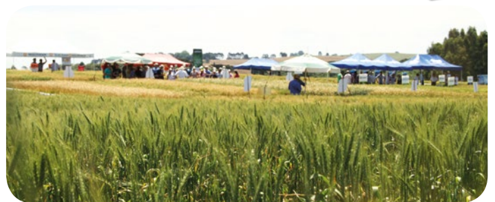
Dia de Campo em Campos Novos

A Copercampos realizou no dia 29 de outubro, no Campo Demonstrativo da cooperativa, mais uma edição do Dia de Campo - Culturas de Inverno, onde os produtores puderam conferir lançamentos em cultivares de trigo, cevada, forrageiras, aveia branca e aveia preta. No evento também foram demonstradas as principais técnicas de manejo dessas culturas, e também manejo de plantas daninhas de difícil controle. O evento contou com a participação de 120 visitantes, incluindo a participação dos alunos da Universidade do Estado de Santa Catarina - UDESC. A Copercampos também realizou mais quatro Dias de Campo, nas regiões de Bom Retiro, Ituporanga, São José do Ouro e Witmarsun, onde os produtores puderam conferir os resultados obtidos e a adaptação das culturas de acordo com cada região.