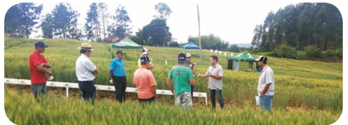
Dia de Campo em Witmarsun