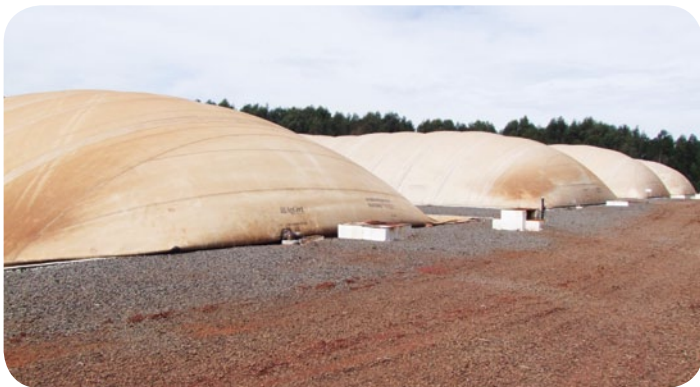
Biodigestores produzem biogás que é transformado em energia