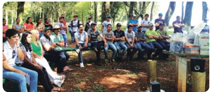
Confraternização 10 anos Granja Floresta