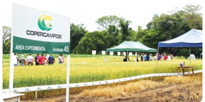
Dia de Campo de Ituporanga