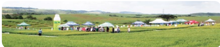
Dia de Campo de Campos Novos

A Copercampos buscando sempre oferecer alternativas de produção aos agricultores, realizou no dia 23 de outubro o primeiro Dia de Campo de Trigo na unidade de Ituporanga, e no dia 30 de outubro o evento foi realizado no Campo Demonstrativo de Campos Novos. Em ambos os Dias de Campo, os produtores puderam conhecer e conferir as novidades tecnológicas e as soluções de manejo disponíveis para as culturas de inverno.