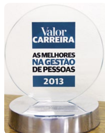
Prêmio Valor Carreira 2013

O Diretor Vice-presidente destaca também que um dos desafios da Copercampos foi desenvolver um método de avaliação e de desempenho que sistematizasse as normas e regras da cooperativa e valorizasse mais claramente a performance individual dos funcionários. Através disto em Dezembro de 2012, a Copercampos iniciou o Programa de Gestão de Desempenho, ferramenta usada para avaliação dos funcionários e pagamento do PPR. "Este método é baseado no cumprimento de metas e responsabilidades individuais e coletivas da cooperativa, entendemos que se o profissional garante o crescimento constante e o lucro progressivo, é justo que aqueles que realmente fazem a diferença no negócio sejam valorizados e mantidos na organização." Comentou o Vice-presidente.