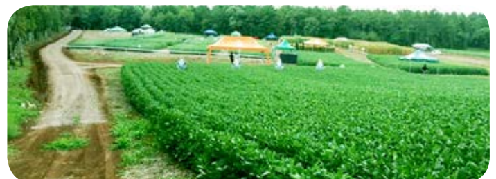
Tarde de Campo em Ibiraiaras/RS