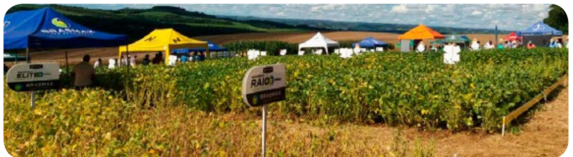
Tarde de Campo em Sananduva/RS

As tardes de Campo realizadas nas unidades da Copercampos, têm como principal objetivo demonstrar aos produtores as características de cada cultura, a adaptação e desenvolvimento das mesmas nas determinadas regiões, e deste modo proporcionar ao produtor uma forma de poder observar na prática e avaliar qual a melhor tecnologia para ser implantada nas lavouras.