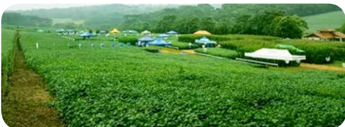
Tarde de campo em São José do Ouro/RS