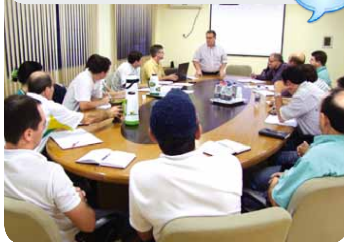
Presidente da Copercampos esteve participando da abertura do encontro

Durante o dia 25 de março, os chefes das unidades da Copercampos estiveram reunidos para debater o andamento dos trabalhos nas filiais e setores da cooperativa.