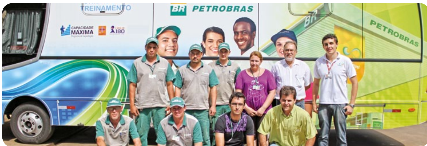
Funcionários do Posto de Combustíveis Copercampos

D urante os dias 27, 28 e 29 de janeiro, os funcionários do Posto de Combustíveis Copercampos participaram de dois treinamentos para que você cliente da cooperativa tenha um atendimento de excelência quando necessitar dos serviços oferecidos no estabelecimento.