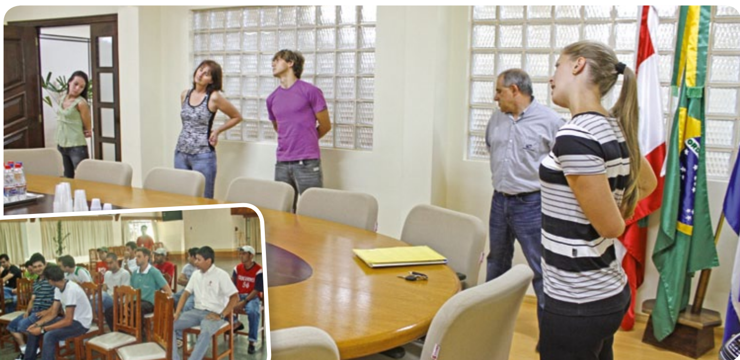
Funcionários realizam atividades de ginástica laboral