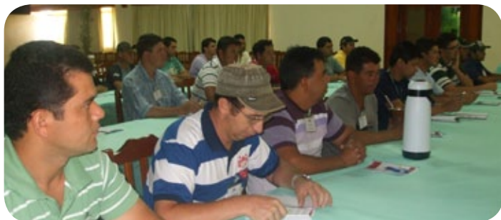
Funcionários do setor operacional participaram do curso