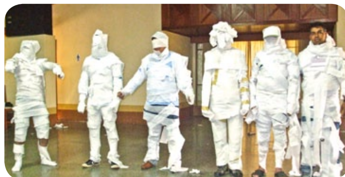
Funcionários do setor operacional participaram do curso

Durante os treinamentos organizados pelo setor de Segurança no Trabalho e Medicina, dinâmicas são realizadas com os participantes dos cursos. O trabalho coletivo na confecção de múmias representam a participação coletiva e a união do grupo para criação das artes humanas.