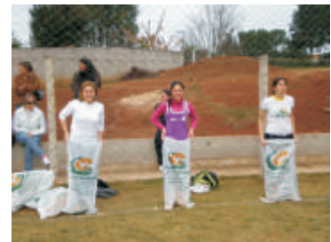
Participação na corrida do saco / revezamento