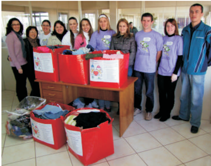
CIPA Copercampos e entidades de Campos Novos