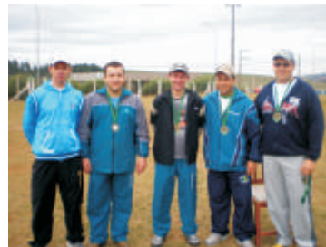
Premiação das competições realizadas no dia 5 de julho

De 3 a 5 de julho foram realizadas as últimas competições da 1ª Olinc (Olimpíadas Internas Copercampos). Na sexta-feira (03) os atletas participaram do General, no sábado (04) aconteceu o Festival da Canção e no domingo (05) a Gincana com a realização de diversas atividades (corrida na tábua, cabo de guerra, corrida do ovo na colher e corrida do saco/revezamento). As competições foram na Associação Atlética Copercampos - AACC.