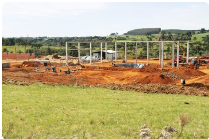
Unidade de Coxilha Rica

Todos esses investimentos são os resultados da determinação e da união existente no trabalho realizado pela cooperativa, investimento estes, que irão proporcionar mais empregos e melhores condições de trabalho aos nossos funcionários, assim como maior comodidade aos nossos clientes e associados, com atendimento de qualidade em serviços e produtos.