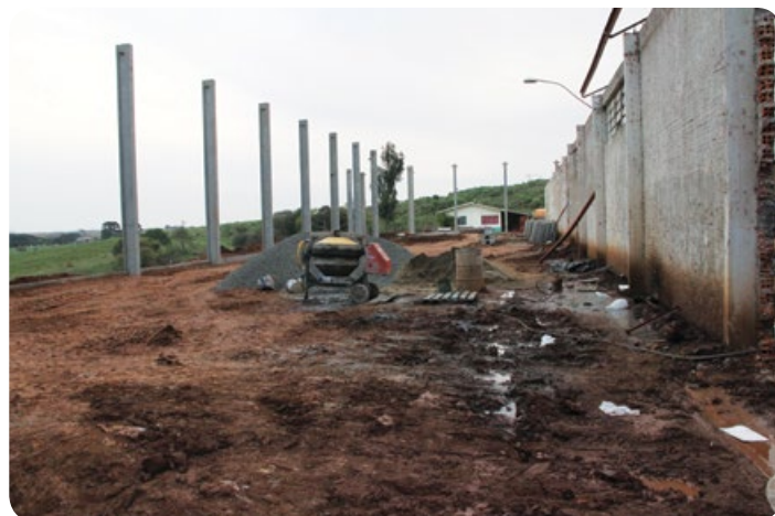
Unidade de recebimento de sementes de Curitibaanos