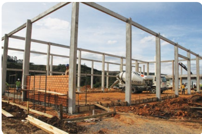
Ampliação Unidade de Ituporanga