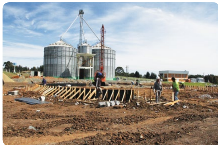
Ampliação área de armazenagem de Otacílio Costa