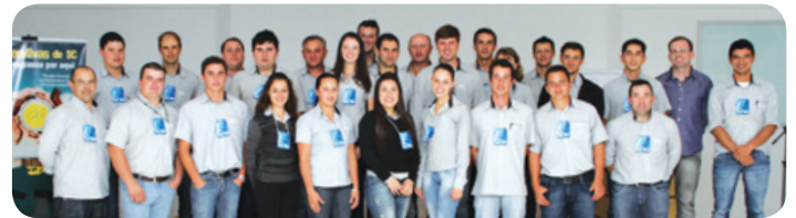
Funcionários que participaram do treinamento

O treinamento contou com 26 funcionários das diversas filiais da Copercampos, que trabalham diretamente ou indiretamente no atendimento aos clientes e associados.