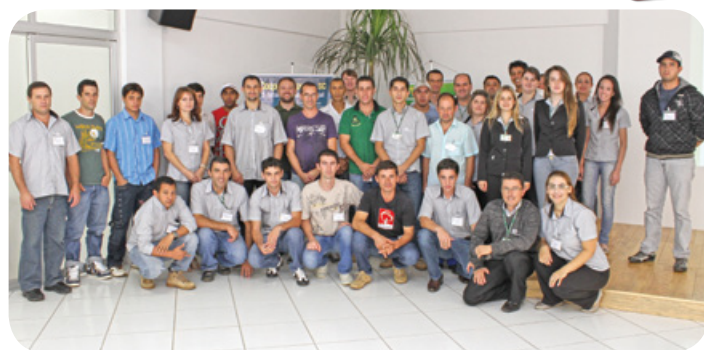
Participantes do curso de reciclagem

A coordenação do Sistema de Gestão da Qualidade da Copercampos realizou no dia 03 de abril, no auditório da matriz, um treinamento de Reciclagem do Programa D-Olho e padronização das atividades dentro da cooperativa.