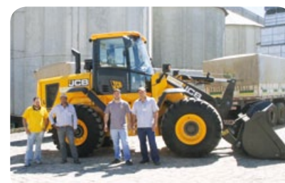
Funcionários recebem treinamento para trabalho com nova carregadeira

Com objetivo de melhorar ainda mais os trabalhos realizados por seus funcionários, a Copercampos adquiriu uma nova carregadeira. Na manhã de 30 de agosto, foi realizado treinamento com funcionários da matriz para auxiliar no funcionamento e manutenção da máquina que irá realizar no carregamento de calcário, assim como outras atividades para a Loja Agropecuária e Armazéns da Matriz.