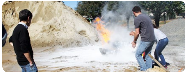
Treinamento Combate a Incêndio