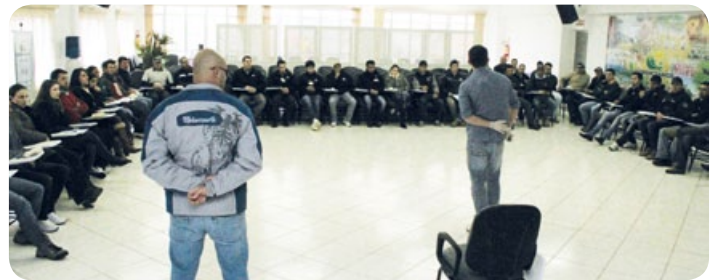
Treinamento Primeiros Socorros