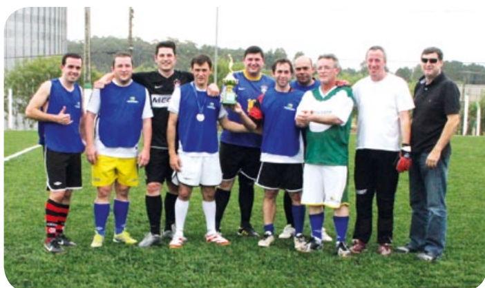
Troféu Itinerante Taça Ivar Antônio Machado