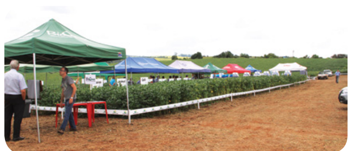
Dia de Campo Unidade de Zortéa