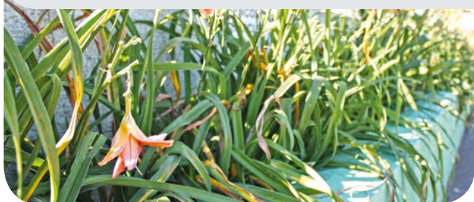
Galhos de flores estão quebrados

É primavera, época do florescimento das flores e você funcionário deve diariamente contemplar a beleza dos canteiros da Copercampos.