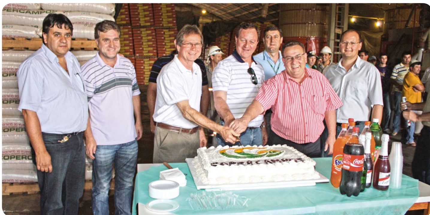
Diretores da Copercampos, gerentes, prefeito municipal Vilivaldo Erich Schmid e deputado federal Valdir Colatto cortam bolo dos 40 anos

tamente com a diretoria da cooperativa, prefeito de Campos Novos Vilivaldo Erich Schmid e o deputado federal Valdir Colatto, a festa foi realizada. Fogos de artifício durante todo o dia, transformaram aquela segunda-feira em um dia único dentro da Copercampos.