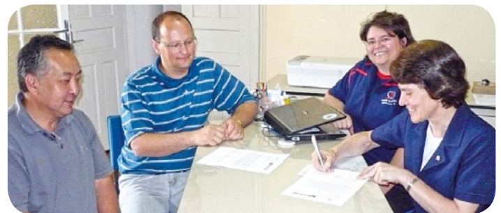
Colégio Auxiliadora e AACC

Se você pretende aprender a arte do xadrez, essa é mais uma oportunidade. Xadrez representa conhecimento e o conhecimento é um elemento fundamental para a vida.