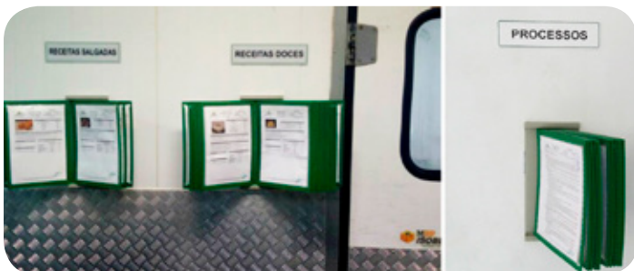
Receituário dos produtos nos Supermercados Procedimentos nos armazéns Apoio: SESCOOP/SC Sistema Gestão da Qualidade

É uma descrição detalhada de todas as operações necessárias para a realização de uma tarefa, ou seja, é um roteiro padronizado para realizar uma atividade, contém instruções sequenciais das operações e a frequência de execução, especificando o responsável pela execução, listagem dos equipamentos; peças e materiais utilizados na tarefa, descrição dos procedimentos da tarefa por atividades críticas; de operação e pontos proibidos de cada tarefa; roteiro de inspeção periódicas dos equipamentos de produção.