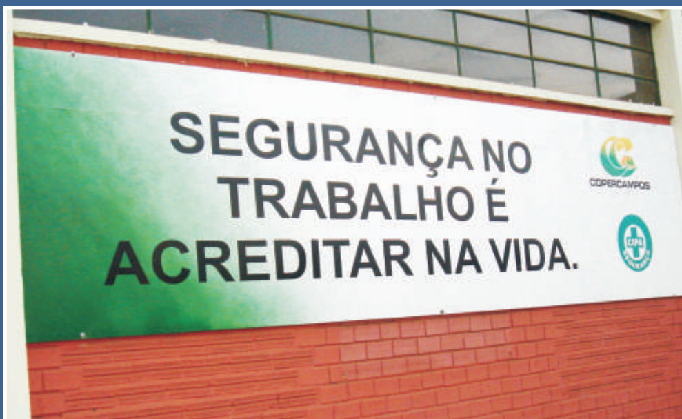
Conscientizar é um dos compromissos da CIPA

A Comissão Interna de Prevenção de Acidentes é hoje a principal aliada no combate a problemas de acidentes no trabalho. Formada por um grupo de pessoas, a CIPA tem como objetivo unir os funcionários em torno do bem-estar de cada um. A idéia é transmitir que muitos problemas podem ser evitados. Prevenir doenças decorrentes do trabalho e garantir a saúde do funcionário são algumas das preocupações.