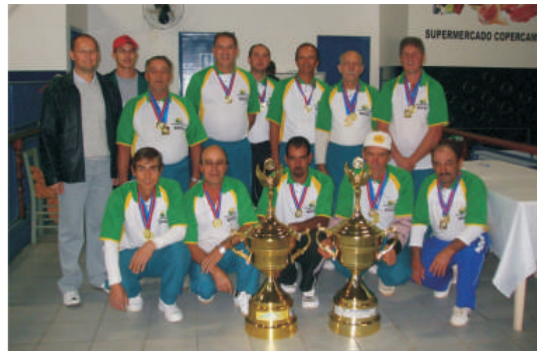
Mais uma vitória no esporte amador

Após vitória na cancha do adversário (Mantovani) e resultado de 1 x 0 em casa, a equipe de Bocha da AACC Copercampos foi a campeã no Campeonato Municipal de Bocha. A final aconteceu na noite do dia 29/05.