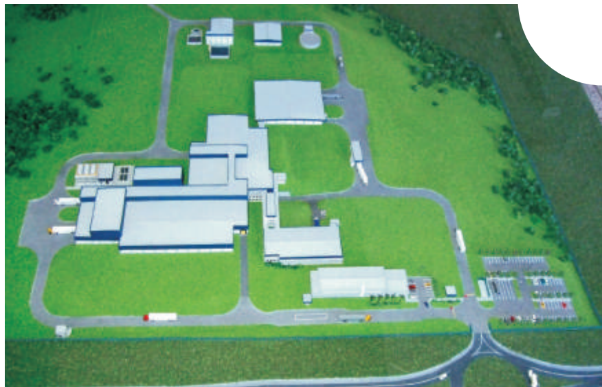
Maquete das futuras instalações