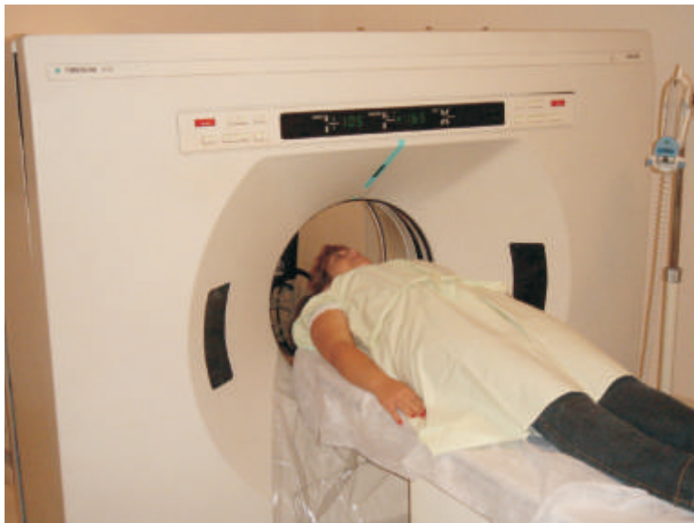
Equipamentos de última geração

Exames disponíveis: Abdômen Superior; Abdômen Total, Articulações; Coluna; Crânio; Face ou seios da face; Órbitas; Mastóides ou ouvidos; pelve; pescoço (Partes mols Laringes); Segmentos Apendiculares (Braços, Pernas); Tórax.