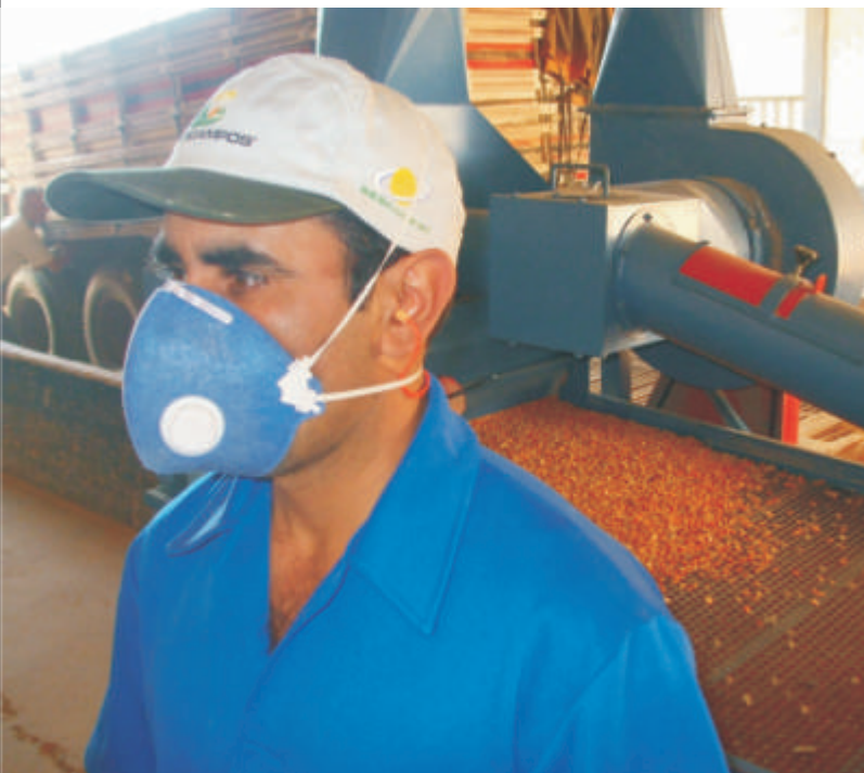
Equipamento usado corretamente pelo funcionário

O Equipamento de Proteção Individual (E.P.I.) é um dos principais recursos adotados para proteger o trabalhador. Essas informações são repassadas através da Comissão Interna de Prevenção de Acidentes. As palestras e o contato