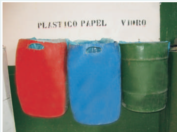
Separação de lixo fixado no interior da granja