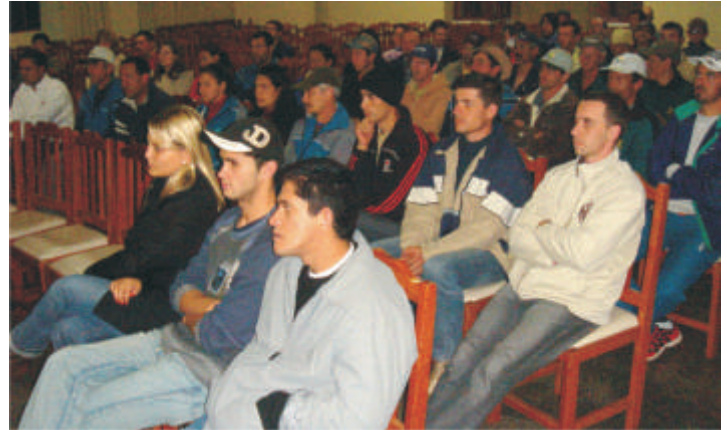
Funcionários das granjas participaram do evento

Funcionários da Granja dos Pinheiros, Floresta e Ibicuí participaram, no dia 05/06, de uma palestra sobre “Uso Racional da Água”. O evento foi realizado na AACCC e estava relacionada ao Dia Mundial do Meio Ambiente e Ecologia. O palestrante foi o senhor Fluvio Eleodoro Marcos, da União Brasil, empresa que presta consultoria a Copercampos.