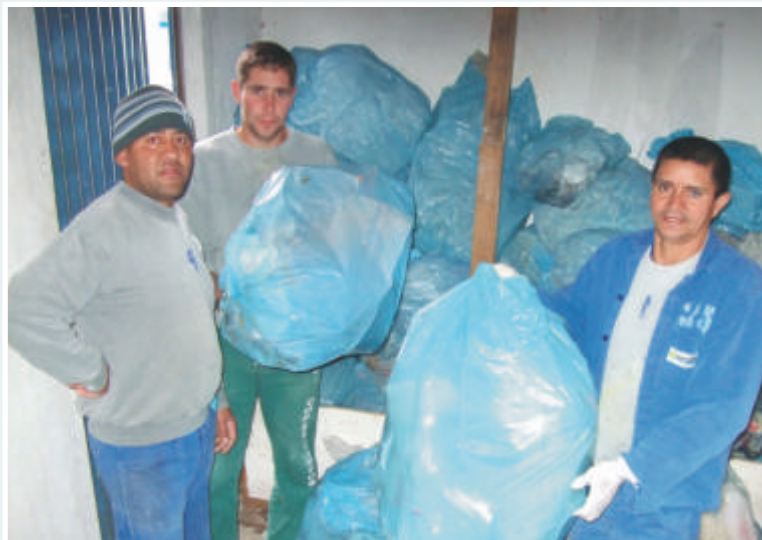
Lixo é ensacado pelos funcionários antes de ser comercializado