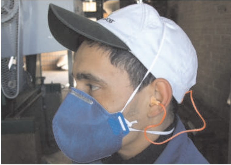
Protetor “plug silicone”