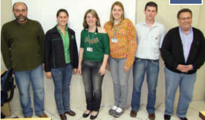
Nova gestão CIPA

Os novos membros da CIPA (Comissão Interna de Prevenção de Acidentes) tomaram posse no dia 26 de setembro, na sala de reuniões da matriz em Campos Novos. Participaram da solenidade, diretoria, gerentes e funcionários. Acompanhe logo abaixo como ficou definido a comissão para o período de um ano a frente da CIPA.