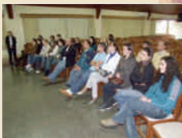
Palestras realizadas com funcionários.