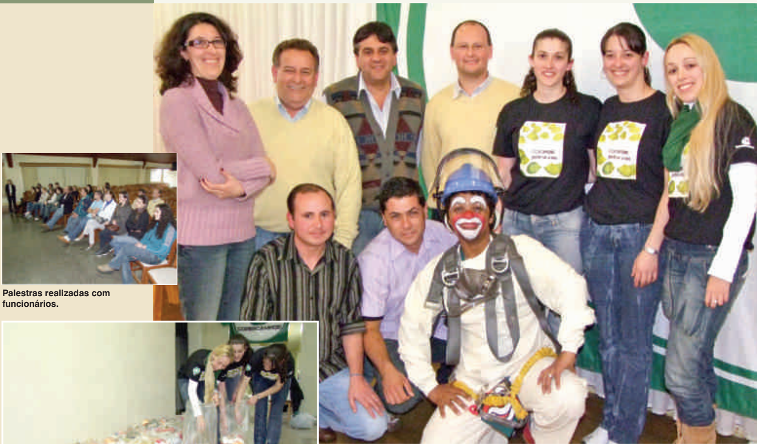
Presidente, gerentes, e funcionários