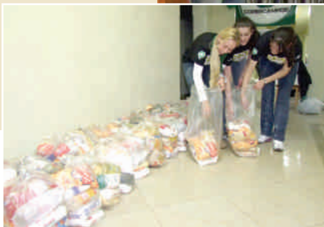
Arrecadação de donativos na semana Sipat