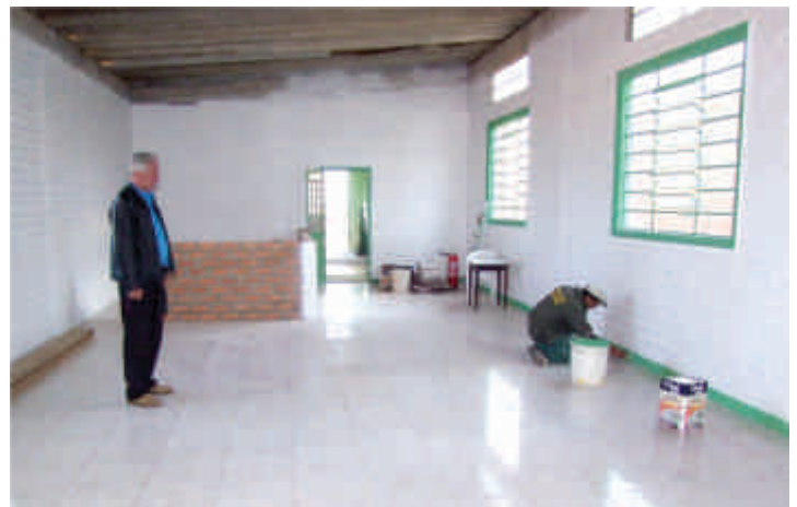
Reformas estão em andamento