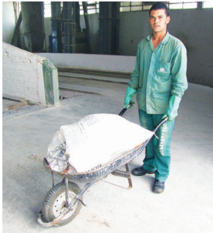
Funcionário utilizando o carrinho de mão para transporte de produtos