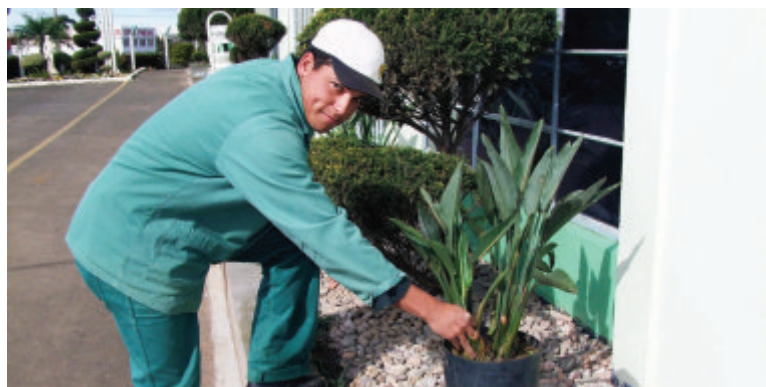
Jardins da matriz em Campos Novos