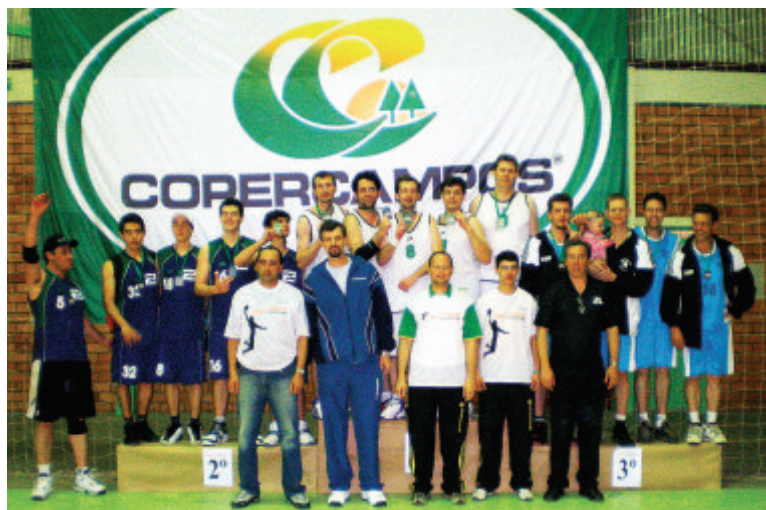
Entrega da premiação – comissão organizadora