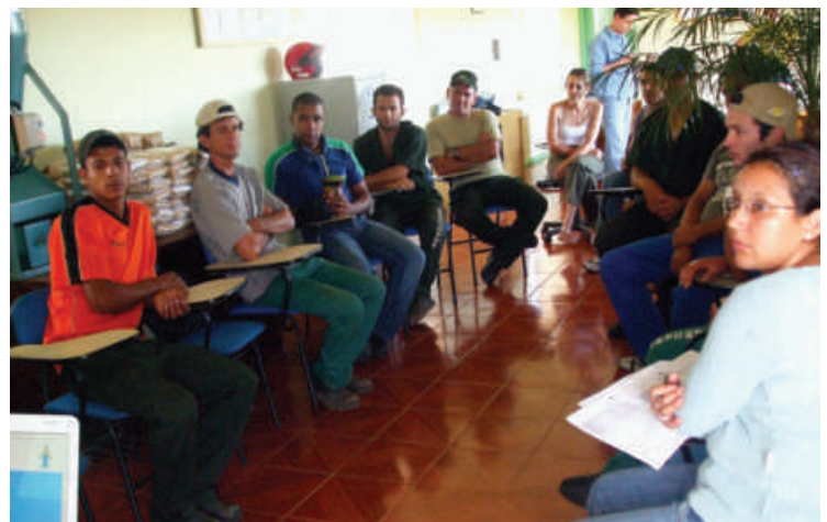
Filial 47 (Trevo Sul - Campos Novos)

A Copercampos realizou no dia 7 de abril, na filial (Trevo Sul) e no dia 17, na AACC, o encontro do “Programa de Integração” para novos funcionários e estagiários. A atividade tem foco na história da cooperativa, missão, áreas de negócios e o que a sociedade-empresa espera do novo quadro funcional. Um grupo de funcionários da Copercampos é responsável pelo conteúdo transmitido.