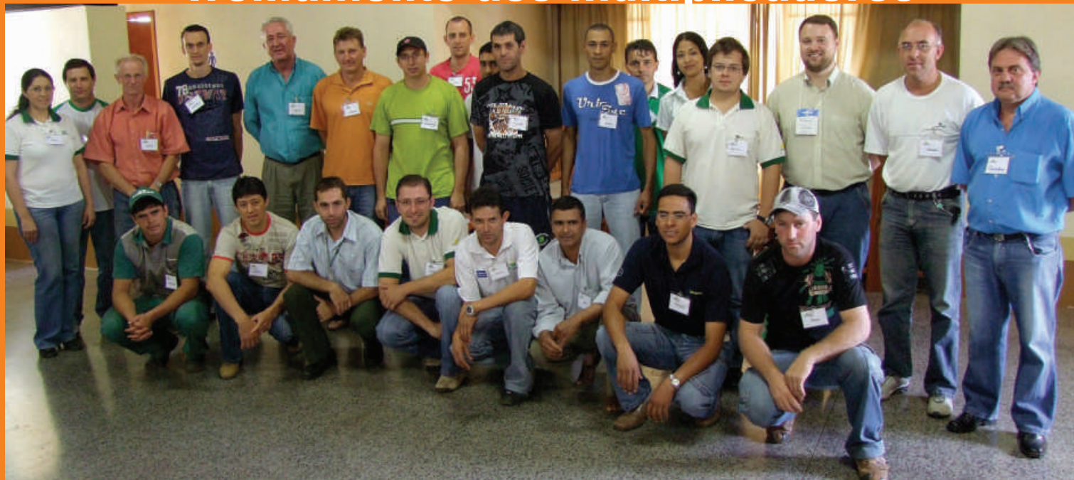
Um dos grupos participantes da atividade

Setenta funcionários participaram nos dias 14 e 15 de abril, do primeiro encontro do Programa "Gestão da Qualidade". O treinamento foi realizado junto aos multiplicadores responsáveis em transmitir as informações aos funcionários de cada setor. A primeira etapa que está sendo aplicada no mês de abril e primeira quinzena de maio envolve o “preparo do ambiente e a prática do descarte” . No total serão cinco