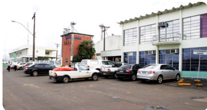
Estacionamento é destinado a visitantes e clientes