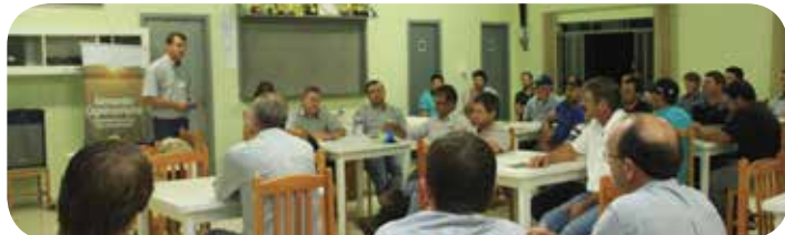
Campo Belo do Sul 15/03

Os dois últimos encontros foram realizados nas filiais de Cerro Negro e Otacílio Costa nos dias 15 e 17 de março.