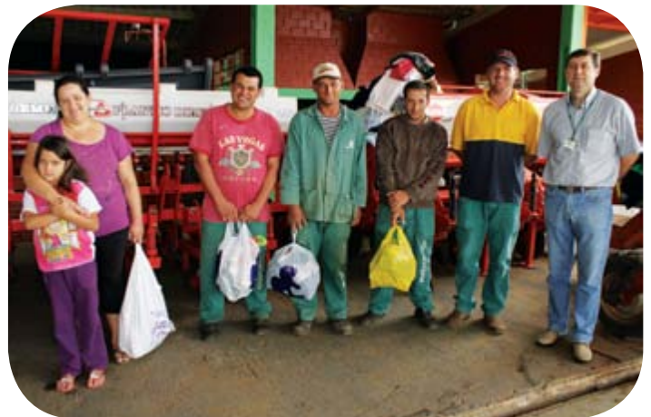
Funcionários do Campo Demonstrativo