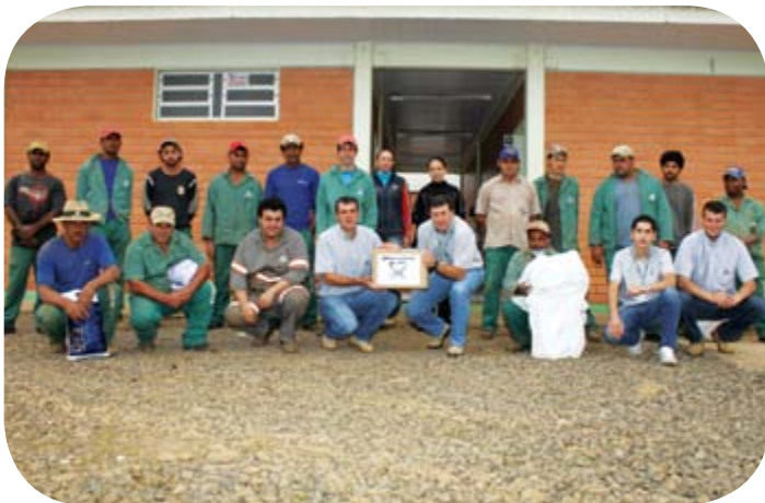
Funcionários da Indústria de Fertilizantes receberam doações e agradeceram a todos que colaboraram com a Campanha do Agasalho 2012