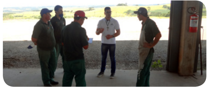
Reunião de apresentação da Qualidade em visita às novas filiais do Rio Grande do Sul

A Copercampos tem crescido diariamente, assim a presença nas filiais acaba tornando-se menor, e com a ajuda e dedicação dos multiplicadores o trabalho é contínuo.