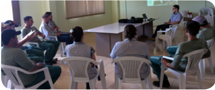
Reunião de apresentação do diagnóstico de melhorias na filial 74

Com as devidas orientações e colaboração, diversas unidades têm mostrado muitas melhorias.