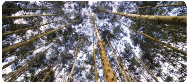
Área de reflorestamento da Copercampos

Com áreas reflorestadas, a Copercampos auxilia na preservação da fauna e flora, suprimindo também a demanda de madeira a ser queimada pelos secadores de grãos.