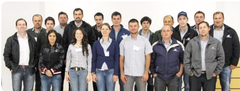
Participantes da 2ª turma do curso de Comunicação e Oratória eficaz em vendas

pessoais e profissionais para um atendimento eficaz dentro da cooperativa. O treinamento contou com 26 funcionários das diversas filiais da Copercampos, que trabalham diretamente ou indiretamente no atendimento aos clientes e associados.