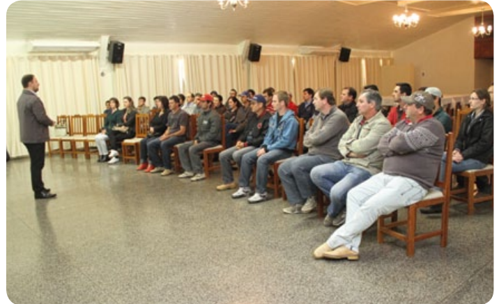
Associados participam do programa