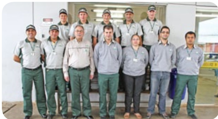
Frentistas, caixas e gerência do Posto de Combustíveis Copercampos estão desde a segunda-feira (20/06), com novo uniforme

A qualidade dos combustíveis Petrobras e o atendimento diferenciado você já conhece e agora, um novo modelo de uniforme foi desenvolvido pela empresa para que os funcionários do Posto de Combustíveis Copercampos tenham ainda mais destaque para atender você cliente.