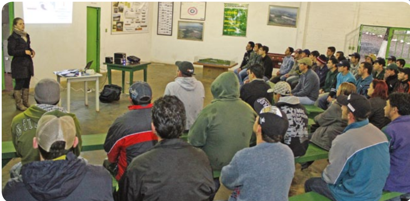
Granja Floresta realiza reuniões a cada dois meses para orientar funcionários sobre o uso consciente de água e sobre como se prevenir contra doenças

Realizar atividades físicas regularmente é essencial para a saúde. Métodos de prevenção são apresentados diariamente aos trabalhadores da Copercampos e na Granja Floresta, as preocupações vão além.